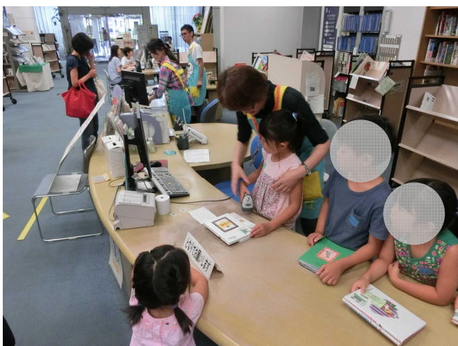
自分の選んだ本の貸出の体験