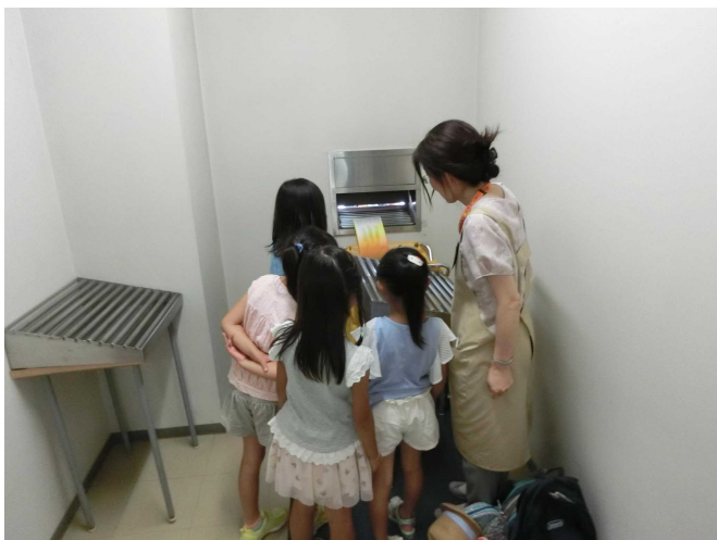
ブックポストの内側を見学