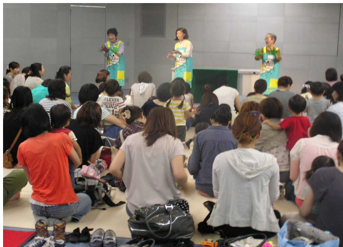
ボランティアによるおはなし会

オ 参加人数9月末（乳幼児向けおはなし会参加数、リピーターを含む）787人 うちブックスタートパック配布対象者数 199人