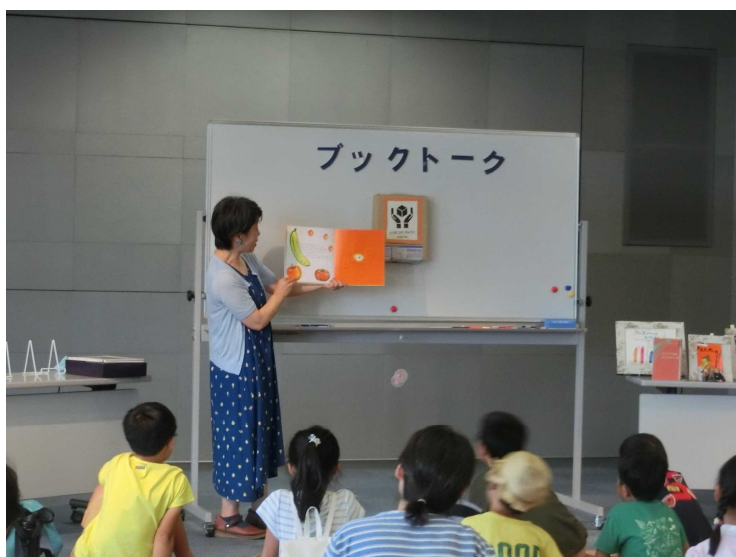
ブックトークの様子