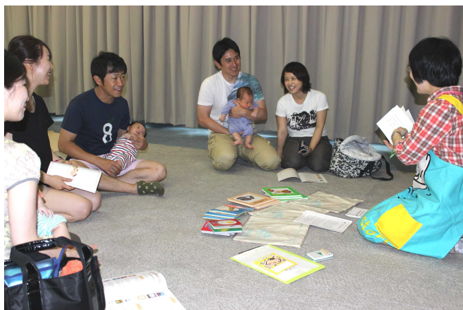
ブックスタートパック配付前に 絵本を説明