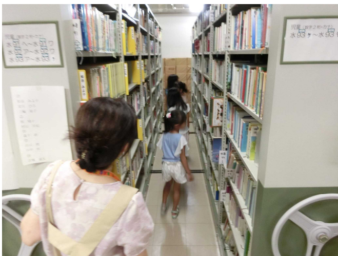
地下閉架書庫の集密書架を見学